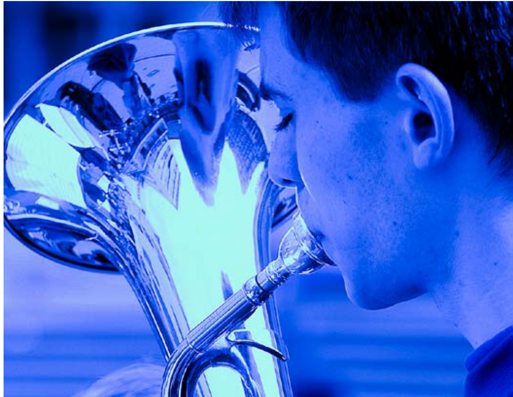
ballade: En undersøkelse gjort av tidsskriftet Ballade viser at ”blå” kommuner har kulturskolene med de dyreste elevplassene.

Lavest ligger Sosialistisk Venstreparti og Senterpartiet når alle norske kommuner er tatt med. SV har en snittpris på 1814 kroner, Sp-kommunene ender med et snitt på 2171 kroner.