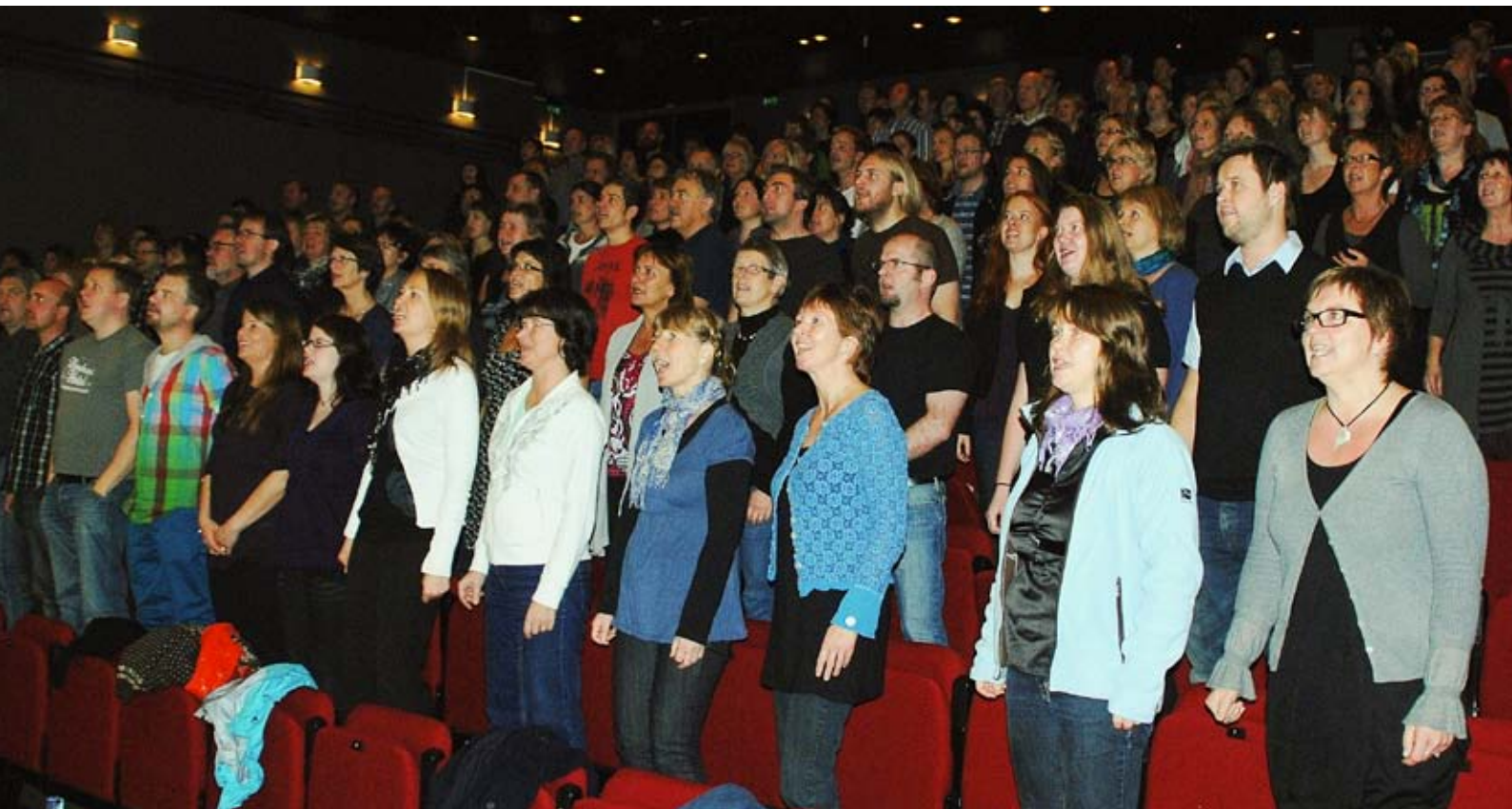
kor landet rundt: Hundrevis av "éndagskor" har blitt til i Kor Arti'-regi. I november skjer det 18 ganger til.