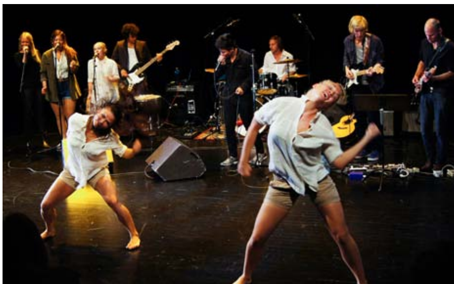
umoja-ensemble: Ungdommer fra region øst viste utdrag fra en forestilling de har framført i Afrika.