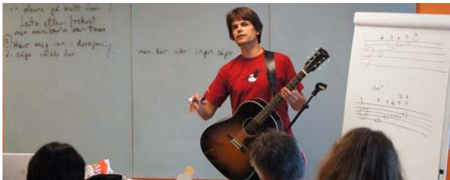
låtsnekring: Lars Bremnes har et og annet å lære bort om hvordan skrive den gode posangen.

Resten av dag én var fylt av i alt 13 verkstedkurs og foredrag, innen de fleste fagområdene i kulturskolen. Det var også en egen tverrfaglig kursrekke begge