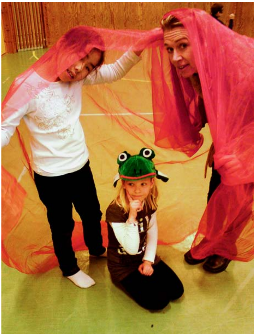
laugvirksomhet II: Litteraturverksted ved Kvam barneskole i Molde.

– Pengene vi har fått fra departementene er ikke nok til å dekke hele fylket. Både fylkeskommunen og kulturskolerådet i Møre og Romsdal har bidratt økonomisk,