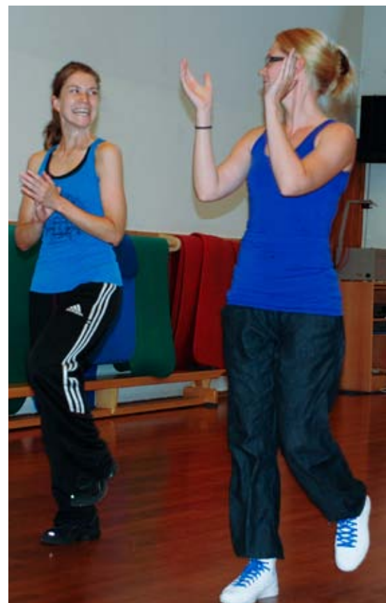
dans landet rundt: 13 Ut på golvet-kurs arrangeres våren 2012.