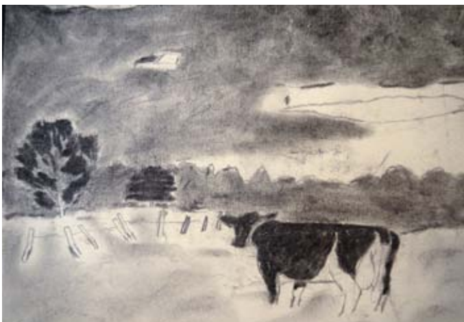
kunstner: Esten Jortveit Trøan alder: 14 år skole: Tolga skole lærer: Helga Storbekken