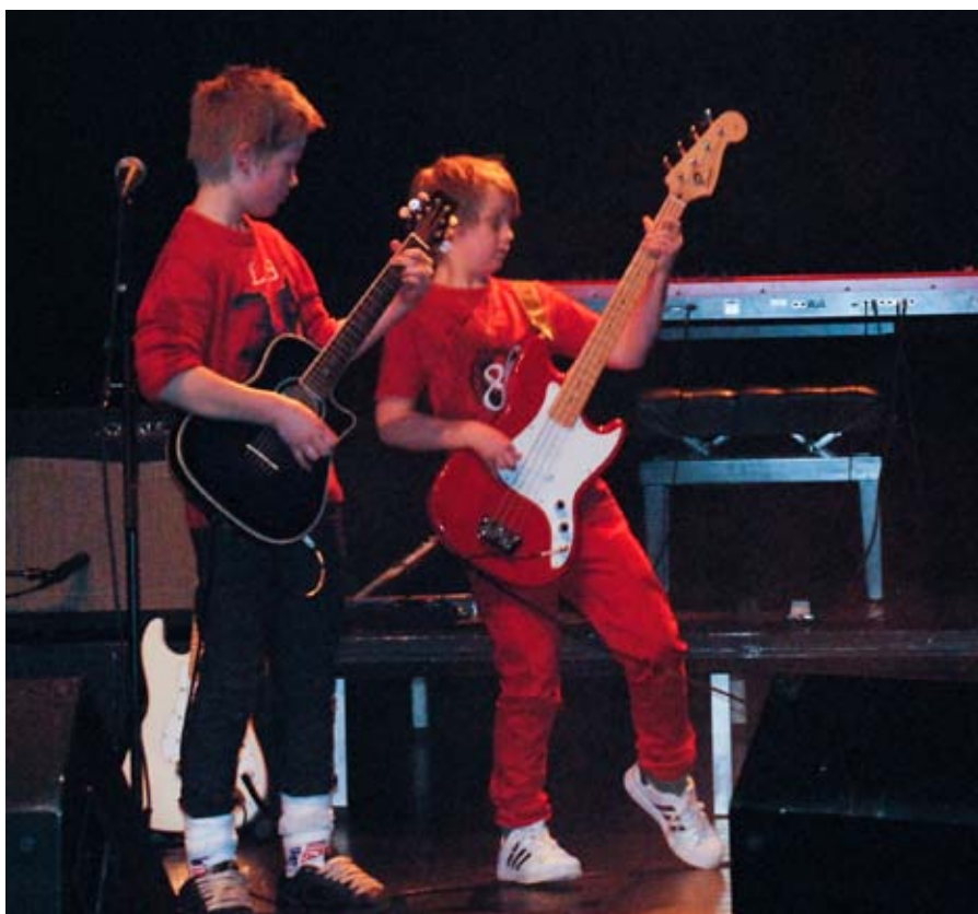
laugvirksomhet I: Låtskriververksted med framføring av unge bandmusikere ved Kulturskolen på Indre Nordmøre.

Da invitasjonen til grunnskolene ble sendt ut først på juni, var det hele 20 forskjellige verksteder å velge blant, som teater, lys og skygge, animasjon,